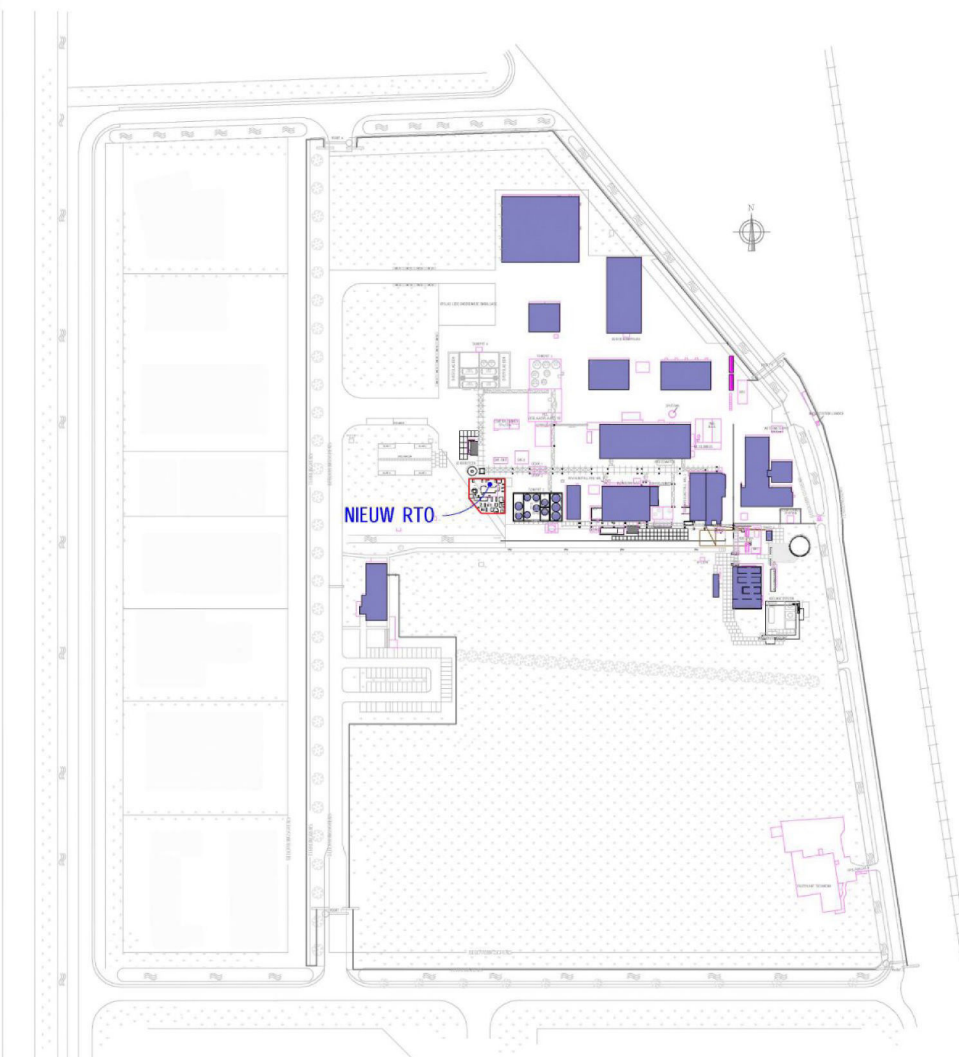
Situatie - Nieuw 1 : 2000