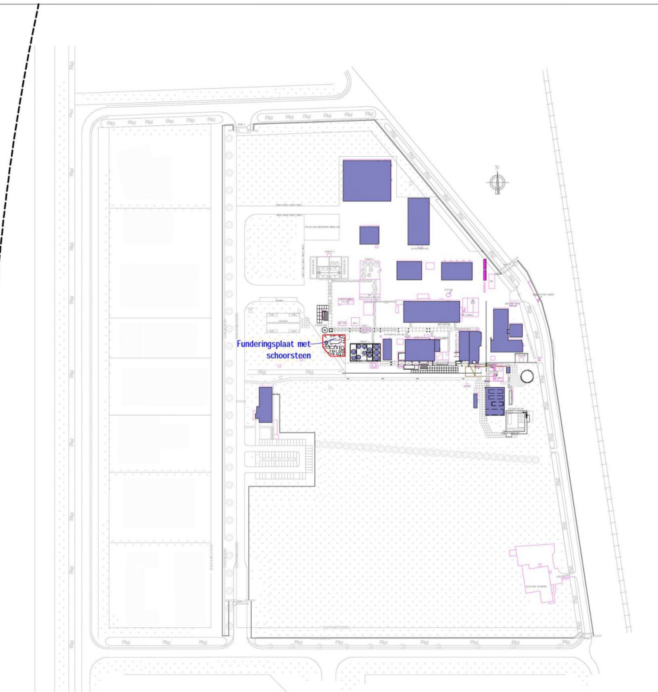
Situatie - Nieuw 1 : 2000